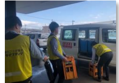
酸素ボンベ搬送時の様子